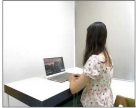
图3：侧后方第二机位效果图。

第二机位设备仅用于监测考试环境，请保证其不会对面试造成干扰。手机作为第二机位“加入会议”后，在“更多”界面“断开音频”，避免多设备啸叫，如下图所示：